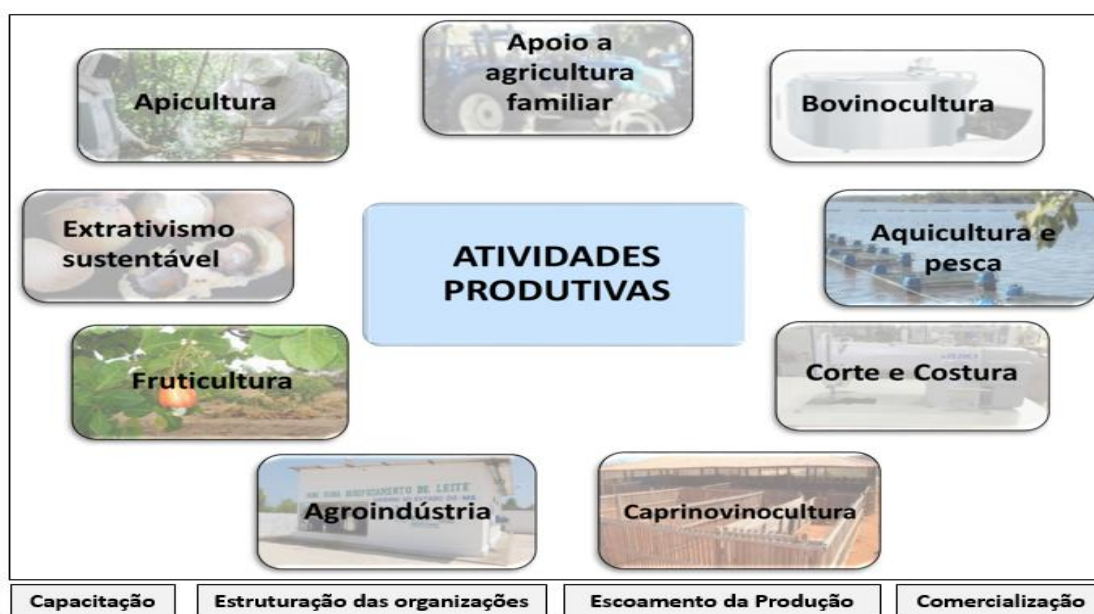
Figura 01: Algumas das atividades produtivas apoiadas pela CODEVASF

O apoio aos Arranjos Produtivos Locais, ocorre de forma continuada ao longo da área da atuação da CODEVASF, por se tratar de ações dinâmicas, tendo em vista que as atividades que visam a produção, sobretudo a de alimentos, estão em constante adequação às demandas de mercado e de necessidade da população regional, nacional e mundial. Neste sentido, a aquisição de máquinas pesadas e caminhões irá contribuir para o desenvolvimento urbano e rural dos municípios, proporcionar infraestrutura logística, melhorar as condições de tráfego de pessoas, produtos e mercadorias, bem como contribuir para a melhoria da qualidade de vida da população e da economia regional.